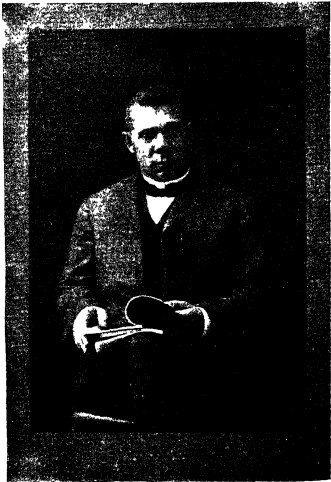
डाक्टर बुकर टी. वाशिंगटन ।